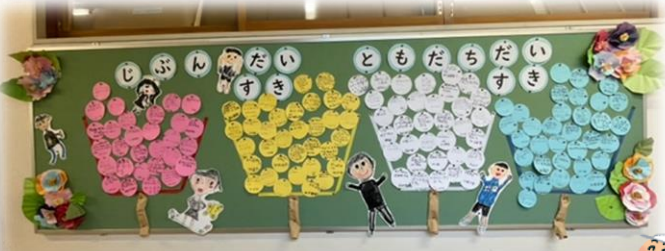
<子どもたちが運動会で頑張りたいことを書いています>